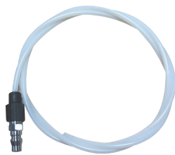
带快速接头的PTFE软管