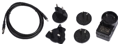
USB 充电器, 带USB-C充电线