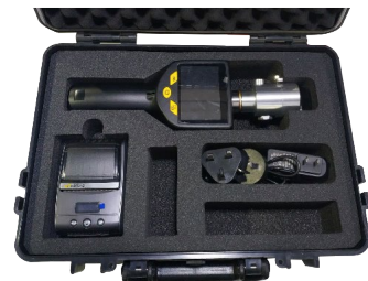
手提箱, 保护测量仪器, 同时存放所有配件