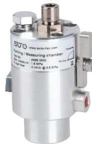
独特的测量/待机测量室, 用于提升传感器响应速度