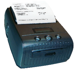
可选: 无线打印机, 用于现场打印测量结果, 为快速审核提供完美解决方案