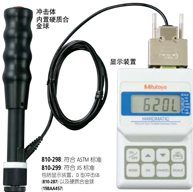
冲击体 内置硬质合金球

HH-411 是便携式里氏硬度计，小巧轻便，易于操作。只需按下按键，任何人都可以进行硬度测量操作，因此它可以广泛地用于车间中各种元件的测量。