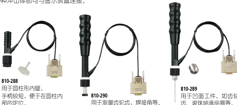
810-288 用于圆柱形内壁。 手柄较短, 便于在圆柱内部的定位。